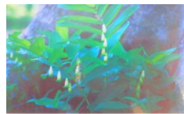
アマドコロ ユリ科 Polygonatum odoratum