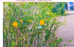
ヤマブキバラ科 Kerria japonica