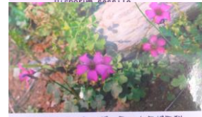
イモカタバミカタバミ科 Oxalis articulata